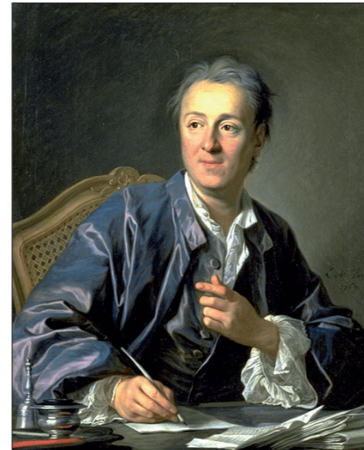
Louis Michel van Loo (1707-1771), Portrait von Denis Diderot, 1767, Paris, Musée du Louvre.

Denis Diderot wurde am 5. Oktober 1713 in Langres in der Region Champagne-Ardenne in einer relativ wohlhabenden Familie geboren. Sein Vater bestimmte ihn zum geistlichen Stand und sandte ihn zu den Jesuiten zur Schule. Trotz seiner Undiszipliniertheit wurden Diderots Fähigkeiten und seine intellektuelle Begabung schnell erkannt; man schickte ihn nach Paris, wo er sich leidenschaftlich wissenschaftlichen und philosophischen Studien hingab. Seine Neugierde hielt ihn aber immer mehr von einer ursprünglich angestrebten beruflichen Ausbildung fern. Sein Vater ermahnte ihn, verweigerte ihm den weiteren Unterhalt, aber Diderot versuchte, sich allein mit Privatstunden in Mathematik und mit im Auftrag Anderer verfassten Predigten zu finanzieren. Er geriet dennoch in finanzielle Schwierigkeiten, machte Schulden und verhungerte beinah. Sei-