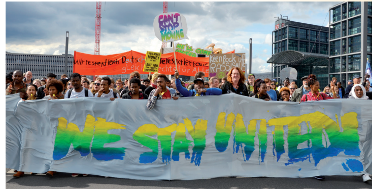
Straßenkarneval „We’ll Come United“