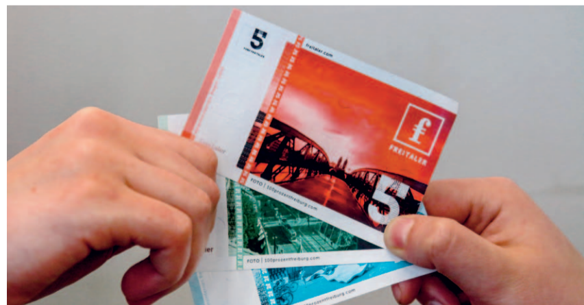
150.000 Freitaler seien jetzt im Umlauf, so der Freitaler Verein.