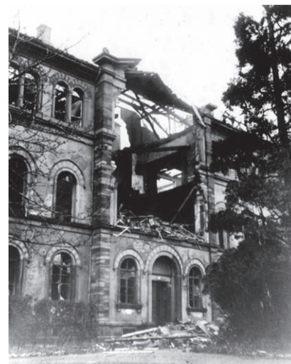
Das Anatomische Institut an der Albertstraße brannte nach dem Bombenangriff im April 1917 gänzlich aus.