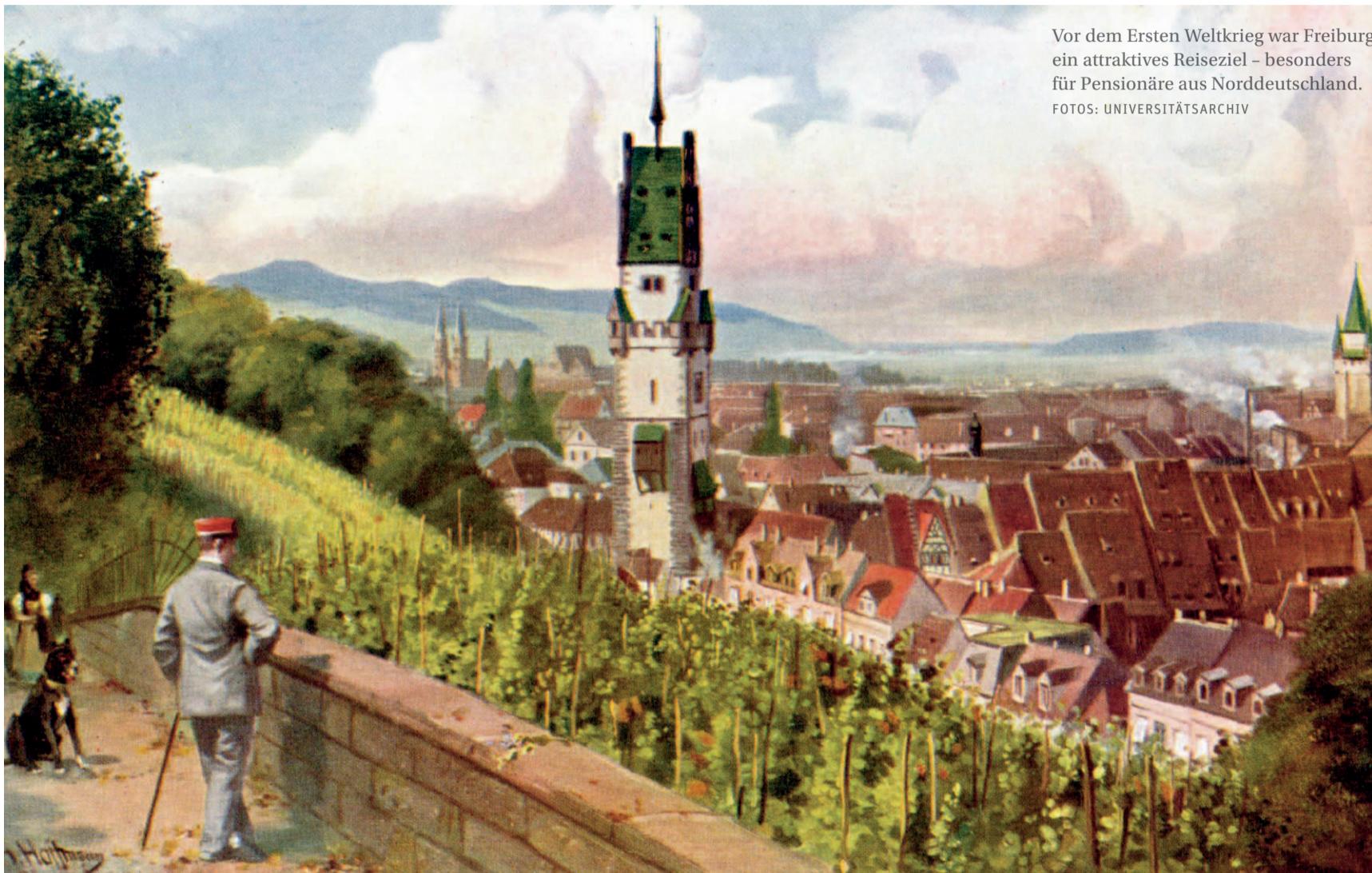
Vor dem Ersten Weltkrieg war Freiburg ein attraktives Reiseziel – besonders für Pensionäre aus Norddeutschland.

Schon kurz nach Kriegsausbruch 1914 wich die anfängliche Euphorie einem gereizten Klima. Der Krieg war im städtischen Alltag spürbar: Artilleriegefechte in den Vogesen waren von Freiburg aus zu sehen und zu hören. Güterzüge nahmen die Bürger als Bombenbedrohung wahr. Als Lazarett- und Frontstadt beherbergte Freiburg während des Kriegs bis zu 100 000 Verletzte, und fungierte als Sammelpunkt für Reichssoldaten. Bis zum Krieg war die Stadt im Schwarzwald noch ein El Dorado für Pensionäre aus Norddeutschland, die in eigens errichteten Villen in der Wiehre ihren Lebensabend verbringen wollten. Mit Kriegsbeginn musste die Tourismusbranche als wichtigster Wirtschaftszweig schwere Verluste hinnehmen. Durch den ausbleibenden Tourismus fühlten sich die Bewohner schon früh vom Rest des Reichs abgeschnitten. Ab 1914 entwickelte sich Freiburg zu