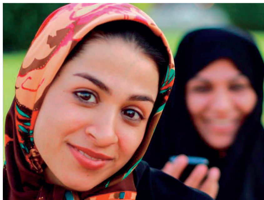
Viele junge Frauen tragen den Schleier als Modeaccessoire.