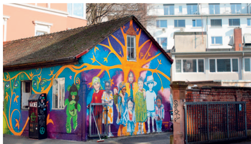
Die Gartenstraße 19 wurde im Jahr 2010 besetzt. Die Frage, wem die Stadt gehört, wird immer aufs Neue in unterschiedlichen Formen gestellt.