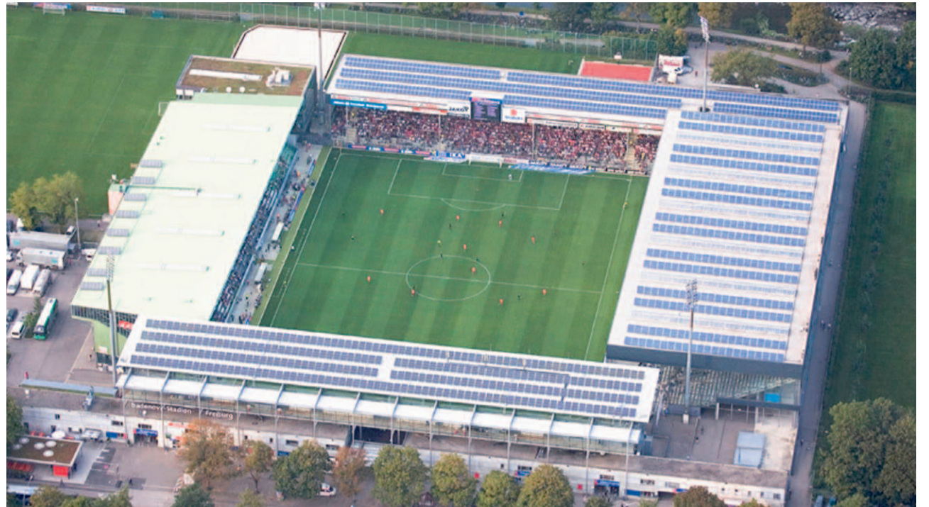
Noch spielt der SC Freiburg hier im Schwarzwald-Stadion im Stadtteil Waldsee an der Schwarzwaldstraße. Seit 1954 werden hier die Heimspiele des Erstligisten ausgetragen – aber nicht mehr lange.

Der Bau des Stadions ist zu einem Festpreis von 70 Millionen Euro ausgeschrieben. Das Finanzierungskonzept war Teil des Bürgerentscheids vom Februar 2015, bei dem 58,2 Prozent der Wahlberechtigten für den Bau des neuen Stadions stimmten. Die Stadt bezahle zwar „das Drumherum“, erklärt Werntgen, allerdings handele es sich bei diesen Ausgaben vor allem um städtische Investitionen in die Infrastruktur, die