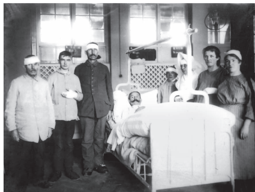
Die Nähe zur Front machte Freiburg zu einer der wichtigsten Lazarettstädte des Deutschen Reichs.

Heute erinnert wenig an dieses schwarze Kapitel der Freiburger Geschichte. Der Zweite Weltkrieg hat im kollektiven Gedächtnis der Stadt das Gedenken an die Zeit von 1914 bis 1918 weitgehend verdrängt. Dabei „steht Freiburg nicht für das typische Schicksal einer deutschen Stadt“, wie Chickering urteilt. Dass der Erste Weltkrieg das Alltagsleben auf so vielen Ebenen berührte, war der geographischen Lage geschuldet. Und trotz allem kam es nicht zu politischen Unruhen wie in anderen Teilen des Reichs. „Da Freiburg kein wichtiger Industriestandort war, waren die Klassenverhältnisse nicht so angespannt wie etwa in Mannheim“, erklärt Chickering. Derartige Widersprüche verdeutlichen das außergewöhnliche Schicksal Freiburgs – trotzdem findet es in der lokalen Erinnerungskultur nur wenig Platz.