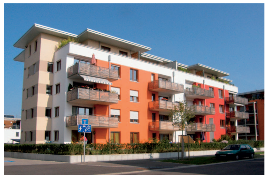
Punkthäuser im Rieselfeld.

Langfristig könnte der neue Stadtteil Dietenbach eine Lösung für den Wohnraumangel sein. Der Bau des neuen Stadtviertels kann jedoch frühestens nach Abschluss der Planungs- und Prüfungsphase im Jahr 2022 beginnen.