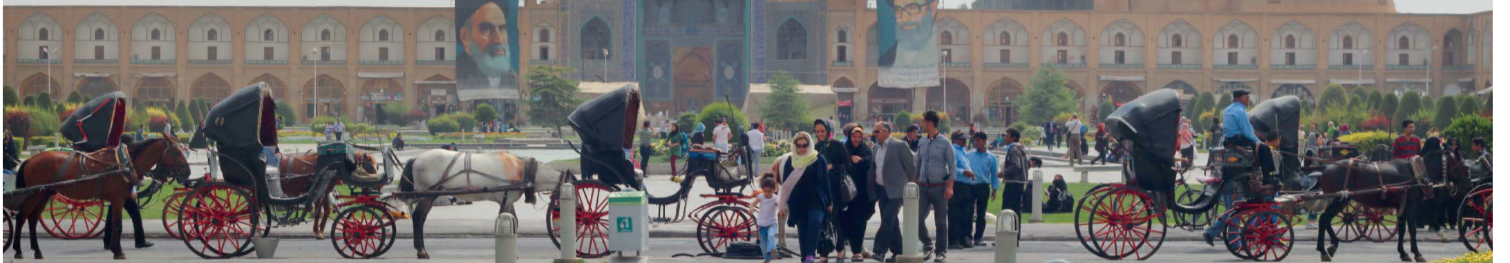
Der belebte „Platz des Imams“ im historischen Zentrum Isfahans ist einer der größten Plätze der Welt.

Freiburg ist die einzige deutsche Stadt, die eine Partnerschaft zu einer iranischen Stadt unterhält. Der Kontakt mit Isfahan ist sehr lebendig, gestaltet sich jedoch aufgrund der politischen Situation nicht immer einfach. Eine Bestandsaufnahme.