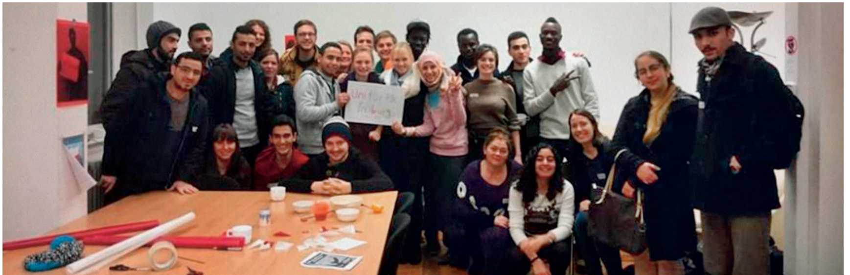
„Uni für alle“: Treffen mit Geflüchteten und Buddys im Wintersemester 2015/2016

Anfang 2016 fand der Infoabend der Studierendeninitiative „Uni für Alle“ statt, die im Sommersemester 2015 gegründet wurde. Interessierte und Neugierige konnten mehr über das sogenannte Buddy-Programm erfahren. Freiburger Studierende können sich als Buddy bewerben: Dieser soll seinem Partner sowohl helfen, sich auf dem Campus zurechtzufinden als auch sich für Seminare anzumelden. Bei dem Programm geht es allerdings nicht nur um die Verwaltung, sondern vor allem um das Miteinander. Die Initiative hat das Ziel, den interkulturellen Austausch zwischen Studierenden und Geflüchteten zu fördern, wovon beide Seiten profitieren.