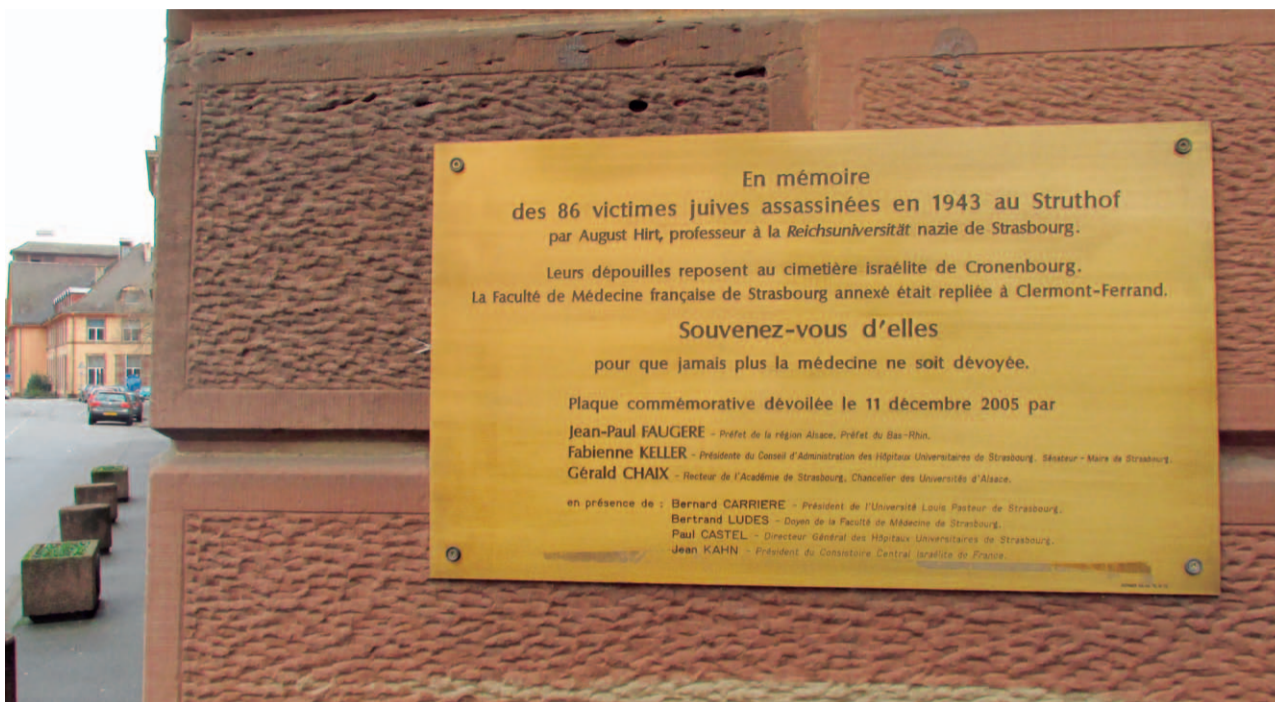
Seit 2005 erinnert eine Gedenktafel am Institut für Anatomie an die 86 Juden, die August Hirt töten ließ. Im Juli 2015 wurden in einer Sammlung der Universität sterbliche Überreste von einem der Opfer gefunden.

Die medizinische Fakultät war 1939 nach Beginn des Zweiten Weltkrieges zusammen mit großen Teilen der Universität nach Clermont-Ferrand geflohen. Erst 1945 kehrten Lehrende und Studierende in ihre ursprünglichen Gebäude an der Universität Straßburg zurück. Einige der Angestellten waren jedoch gezwungen gewesen, unter den Nationalsozialisten an der Universität zu bleiben. „Aus Scham gegenüber den zurückgekehrten Kollegen vermieden es viele der Gebliebenen, über