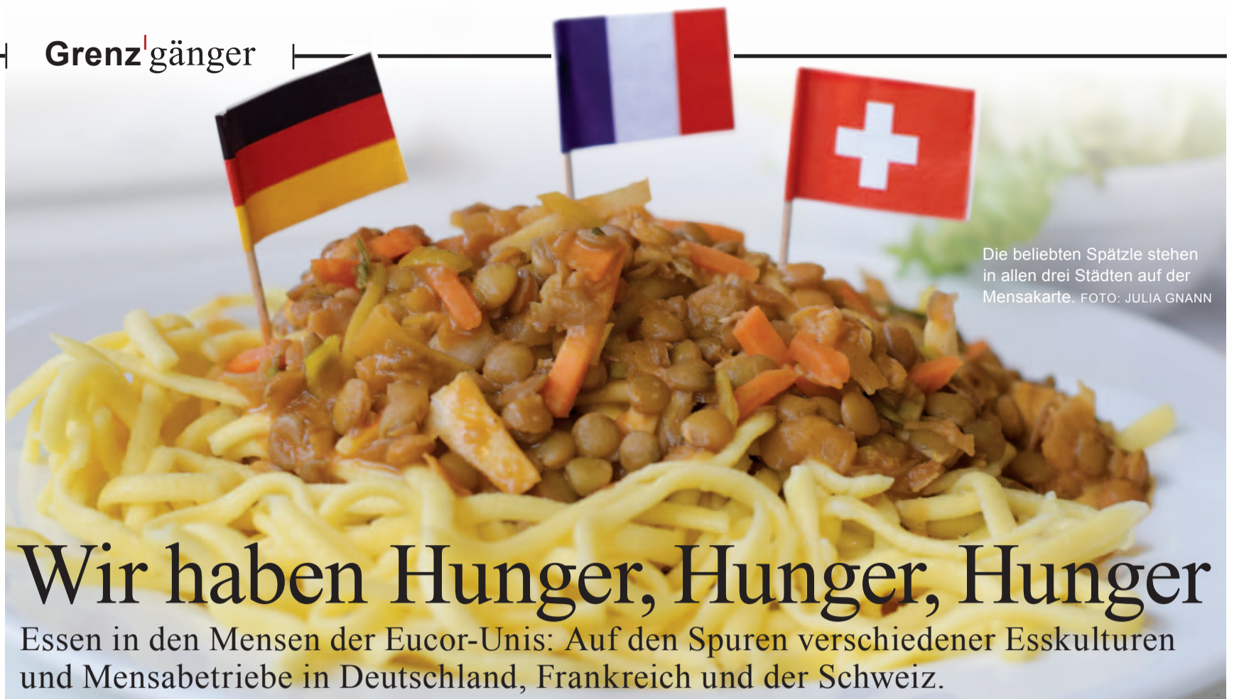
Die beliebten Spätzle stehen in allen drei Städten auf der Mensakarte.

Sprachlehrinstitut (SLI) der Uni Freiburg Universitätsstr. 5. Tel.: 0761 203 32 22. Fragen an maria.petrasch@sl.uni-freiburg.de oder tandem@sl.uni-freiburg.de. Weitere Informationen und Anmeldeformular direkt im Sprachlabor 3, Kollegiengebäude 1 Raum 1030 oder unter sl.uni-freiburg.de.