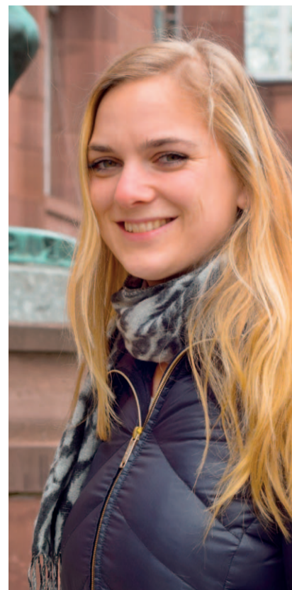
Sophie studiert Jura in Basel, Freiburg und Straßburg.

Auch das Geld für die eine Fahrt, die von der Uni übernommen wird, bekommt sie erst im Laufe des folgenden Semesters zurückerstattet. Doch das ist nicht so einfach, wie es klingt: Am Anfang des Semesters wollte die Uni Freiburg wissen, an welchem Tag der Woche sie plane, nach Straßburg oder Basel zu fahren. Ihre Lehrveranstaltungen finden jedoch nicht immer am selben Tag statt. „Außerdem waren zu Beginn des Semesters noch nicht alle Seminare in Straßburg im Stundenplan aufgeführt“, so die 26-jährige Eucor-Studentin. Dennoch ist sie optimistisch: Sie bewahrt alle Fahrkarten auf, um sie am Ende des Semesters einzureichen und das Geld wiederzubekommen. Sophie versteht, dass