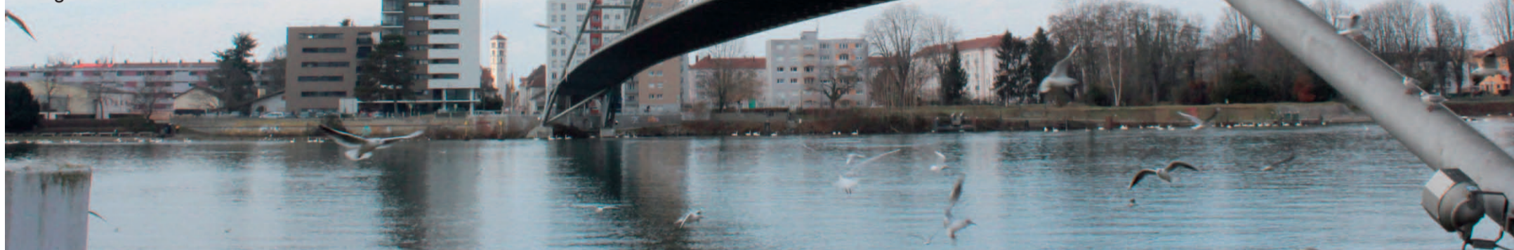
Die Dreiländerbrücke in Weil am Rhein verbindet die drei Eucor-Länder Frankreich, Deutschland und die Schweiz.

Die Menses des Dreiländerecks im Vergleich > 6